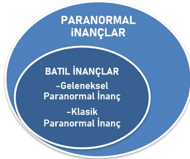
Şekil 1. Paranormal inançlar

Batıl inançlar her dönemde ve her coğrafyada görülmüş fakat hiçbir zaman ortadan kaldırılamamıştır. İnsanlar alay edilme korkusuyla inançlarını başkalarından gizleme yoluna giderek, inançlarını farklı bahanelerle açığa vurmadan yerine getirmiş ve bunu yaşamlarının önemli bir parçası haline getirmişlerdir (Kyendyebai, 2016). Farklı inanç türlerinin toplumsal yaşamda birçok davranışa yön verdiği gözlemlenmektedir. Dini olarak görülmeyen fakat dinden de ayrı tutulamayan Paranormal inanışlar ve çoğunlukla bilgisizlik veya nedenselliğin yanlış anlaşılmasından, bilinmeyene karşı duyulan endişeden kaynaklanan batıl inanışlar, insanları birçok konuda etkisi altına aldığı gibi Covid-19 salgınında aşı konusunda insanların kararsız kalmasına sebep olan bir inanış şeklide olabilir.