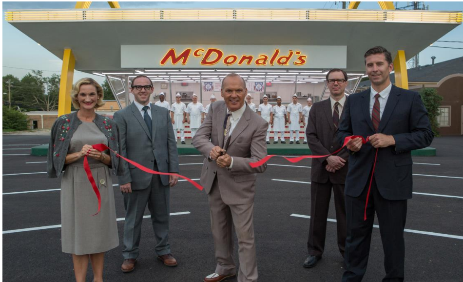
Resim 5. Restoran Açılış Sahnesi

Resim 4’te, tüm faaliyetler belirli bir eğitim çerçevesinde gerçekleştirilmekle birlikte sistematik ve düzenli biçimde işleyişinin, her ürün ve hizmetin aynı standartta ortaya konulduğu resmedilmektedir.