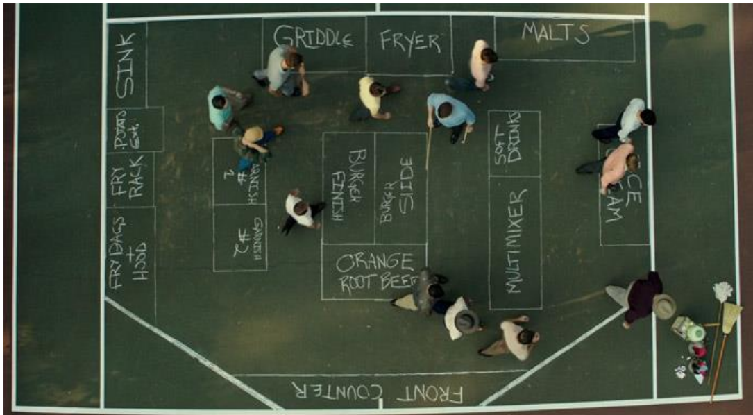
Resim 2. Eğitim İle Restoran İç Tasarım Planı

Resim 1’de filme ait afiş yer almaktadır. Film afişinin farklı ülke ve dillerde aynı türde olarak hazırlandığı görülmektedir. Buna göre baş rol oyuncusu kendinden emin ve sürece hakim olduğunu belirtir biçimde “elleri belinde” resmedilmektedir. Başrol oyuncusunun yer aldığı bu sahneyi ise güçlendirme amaçlı renklerin özellikleri kullanılmış ve tema da sarı-kırmızı olarak yer verilmiştir. Resim ve afişler, görsel kültür ürünleri arasında olduğu göz önünde bulundurulduğunda, filmi izleyecek kişilerin öncelikli olarak afişi görmeleri filme yönelik algılarını da değiştirdiği ve olumlu yönde etkilediği düşünülmektedir.