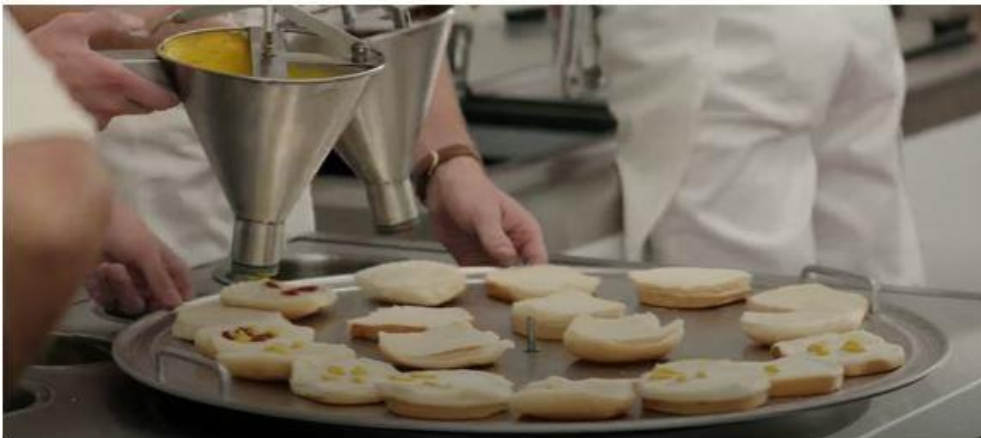
Resim 3. Eğitim İle Gıda Üretim Planı

Resim 3'te yer alan resimlerde, filmde üretim sahnesini canlandırmaktadır. Sahneler filmde uzun süreli tekrar etmekle birlikte görsel açıdan hızlı geçişler (saniyede 2-3 kare), açık ton (beyaz) ışıklı çekim görsel özellikler arasındadır. Karelerde beyaz ton ön plana çıkmakla birlikte eğitim-sistematik-düzen-disiplin kavramları ön plana çıkmaktadır. Filmin bu sahneleri oyuncuların: