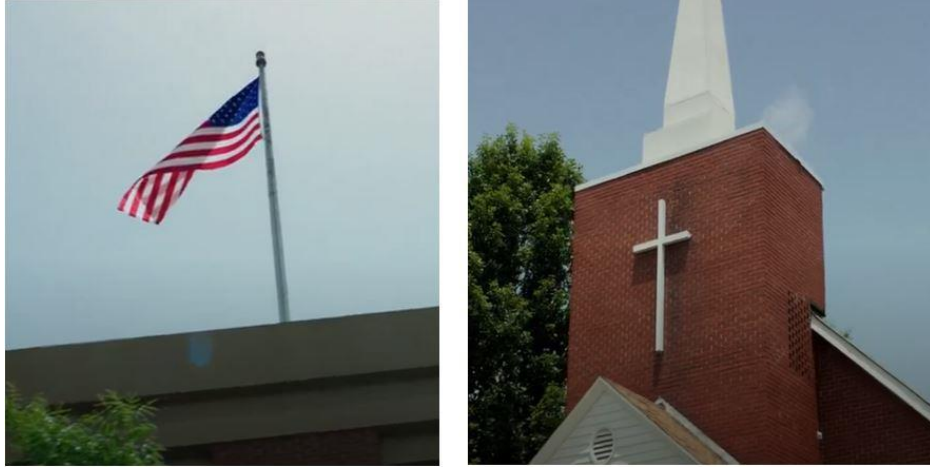
Resim 7. Dini ve Milli Kültür Öğeleri

Resim 7, filmin konu edindiği firmanın yer aldığı Amerika Birleşik Devletleri'nin (ABD)'ye ait ülke bayrağını ve ülkenin çoğunluklu dini inancı olan Hristiyanlığın sembolü olan "Haç" figürünü simgelemektedir. Bu yönü ile ABD'nin kültürel özelliklerini simgeler niteliktedir.