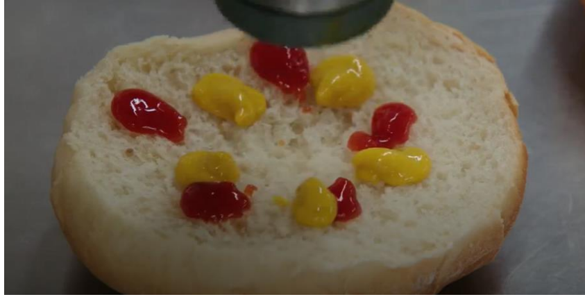
Resim 4. Üretilen Bir Ürün ve İçerik

söylemleri sahneleri desteklemektedir. Örneğin resim 4’te görüldüğü üzere her hamburgerin aynı olduğu ve içerisinde bulunan sos (ketçap ve hardalın) içeriklerinin belirli miktarda olduğu anlaşılmaktadır.